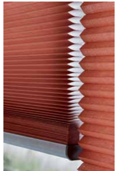
Duette® passer perfekt til kontoret og giver et varmt og stilfuldt udtryk.